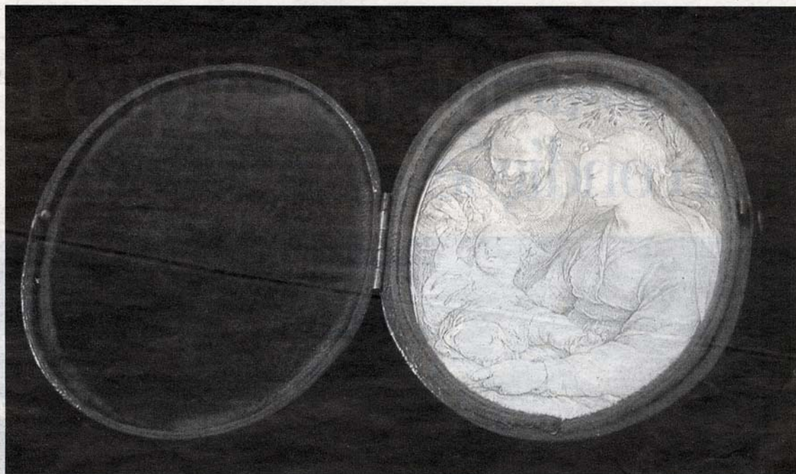
'Sagrada Família', atribuído a Hendrick Goltzius (1558-1617), prata gravada montada em estojo. Uma peça que impressionou os especialistas.