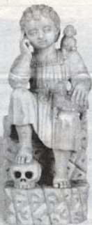
'Bom-Pastor', uma pequena escultura em marfim (Índia, Goa, século XVII) que figurará também na exposição que incluirá 77 peças de ourivesaria sacra e civil, escultura, fotografia, mobiliário e outras coleções.

Este projecto surge no âmbito do INTERREG III B, e, como já noticiámos, o seu orçamento total para a Madeira é de 350 mil euros (2007/2008), competindo à RAM contribuir com 52 mil euros. Verbas importantes para restaurar algumas peças importantes, que agora serão apresentadas na mostra a inaugurar em breve.