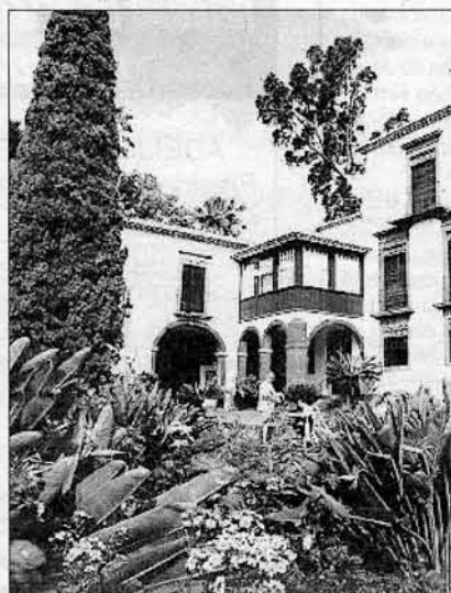
> Actividades do museu divulgadas

Com periodicidade semestral e a assinalar, entre outras iniciativas, este Dia Internacional dos Museus, acaba de ser editado o primeiro número do Boletim Museu Quinta das Cruzes, concretizando um importante objectivo que é o de melhor divulgar a imagem e as actividades do Museu no exterior.