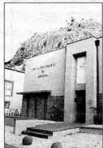
do pela Escola Básica de 1.º Ciclo da Ribeira Brava. Pelas 10h45, está prevista a actuação do Grupo Folclórico do

Para comemorar o Dia Internacional dos Museus, os serviços educativos do Museu Etnográfico da Madeira, na Ribeira Brava, preparam um programa de actividades, com a colaboração dos técnicos da Direcção Regional de Educação e Reabilitação (DRER), através do Centro de Apoio Psicopedagógico da Ribeira Brava e da Casa de Saúde de São João de Deus. Com o objectivo de abordar o tema "Museu sem barreiras", tendo em atenção a acessibilidade do público com mobilidade reduzida e com outro tipo de deficiência decorrerão, durante todo o dia, várias actividades ligadas a esta problemática dirigidas à comunidade escolar local e ao público em geral. Desta feita, o Museu promove uma "Gincana de acessibilidades" e um "Atelier de expressão plástica", no qual os grupos de visitantes podem, através de várias formas de expressão, "falar" sobre a sua visita ao museu e o tema tratado. Mas, o programa começa às 10h30, com um momento musical organiza-