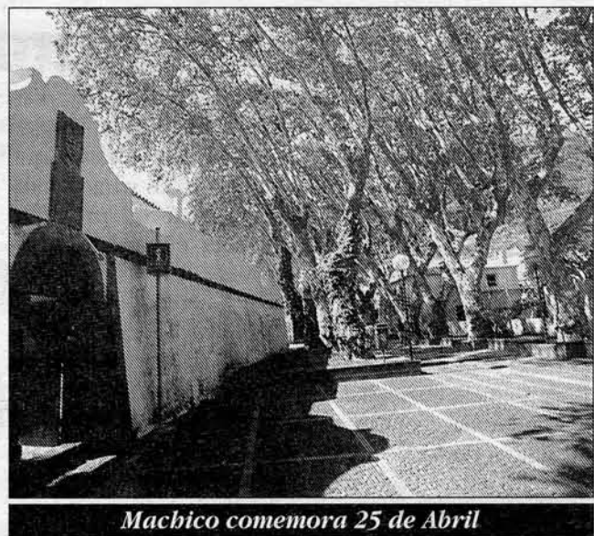
Machico comemora 25 de Abril

O programa prossegue com um espectáculo, cujo